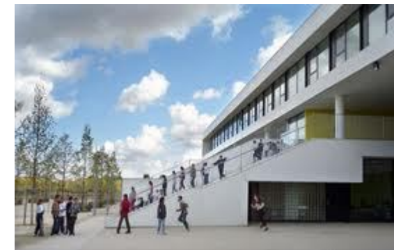
Illustration Conseil Général du Val de Marne